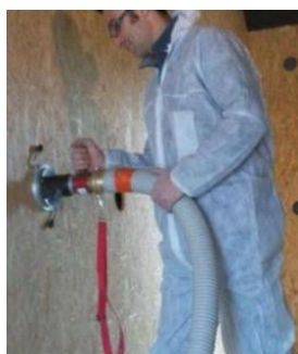
Insufflation isolante en vrac