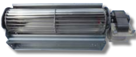
Exemple de ventilateur tangentiel.