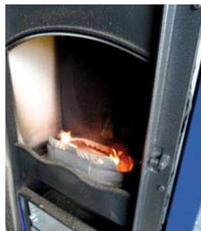
Exemple de foyer.