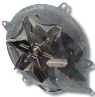
Extracteur de fumée démonté.