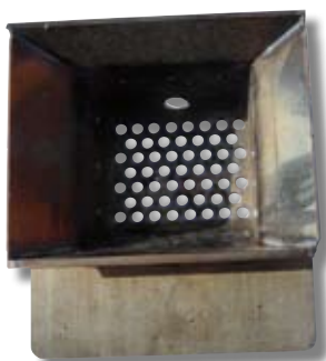
Exemple de creuset.