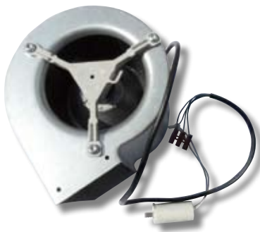
Exemple de ventilateur centrifuge.