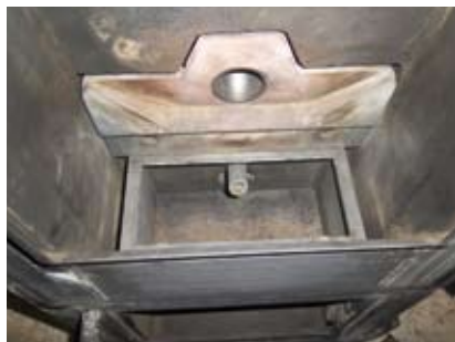
Vue intérieure sans le creuset : arrivée d'air et bougie d'allumage.

Il existe des contrats d'entretien vous permettant de programmer en toute confiance l'intervention de nettoyage par votre professionnel.