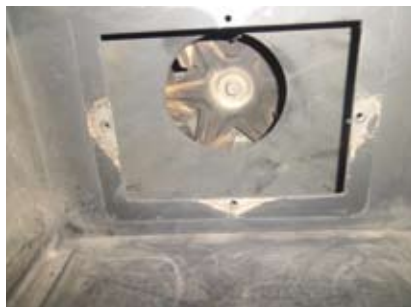
Vue intérieure : extracteur de fumée.