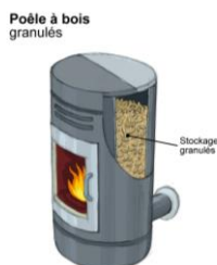
Poêle à bois granulés