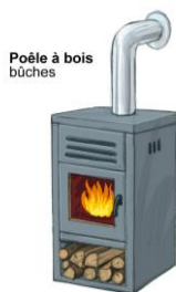
Poêle à bois bûches