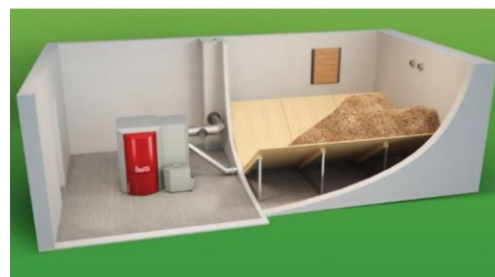
Local dédié avec pan incliné et alimentation par vis sans fin