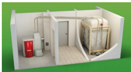
Silo textile et alimentation par aspiration